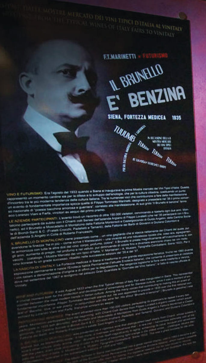
"Il Brunello è benzina", il motto creato da Filippo Tommaso Marinetti in occasione della prima Mostra mercato dei Vini tipici d'Italia, svoltasi a Siena nel 1933 "Brunello is gasoline!" The slogan of the first Wine Fair of top Italian wines in Siena (1933) had been penned by the founder of the Futurism: Filippo Tommaso Marinetti.

ORARI OPENING HOURS su prenotazione. Aperto tutti i giorni, Festivi compresi, stesso orario del Punto vendita | Wine Shop Fattoria dei Barbi/ advance booking required. Open every day, including holidays. The opening time of the Brunello Museum is same as the opening time of Fattoria dei Barbi Wine Shop.